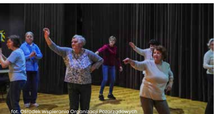
fot. Ośrodek Wspierania Organizacji Pozarządowych