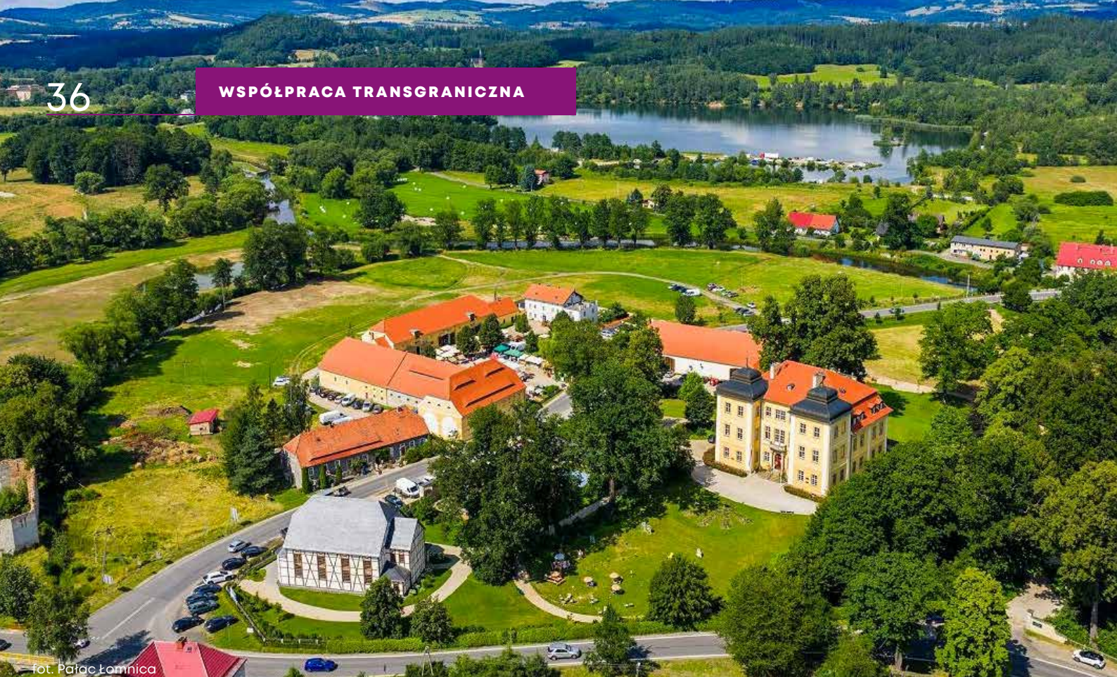
– fot. Pałac Łomnica